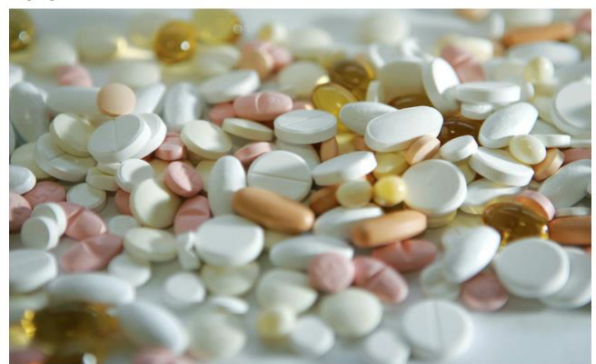
Lyfjaleifar fundust hérlendis.