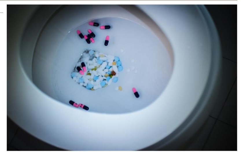
Skila á öllum lyfjaafgöngum til apóteka.

Stefna Evrópusambandsins inniheldur fjölmargar aðgerðir sem hrinda á í framkvæmd. Þær aðgerðir sem nefndar eru: